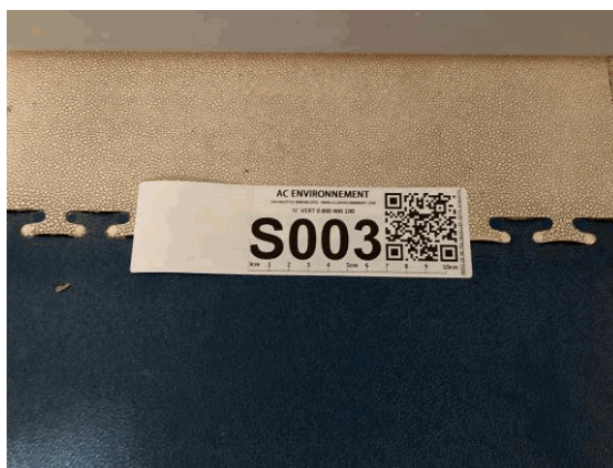
S3 - 1 (S3) - CAISSE NATIONALE MILITAIRE DU SECURITE SOCIALE - Vol 2 (Cafétéria)