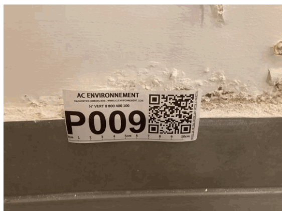
002ER361257 n°9 - 1 (P9) - CAISSE NATIONALE MILITAIRE DU SECURITE SOCIALE - Vol 2 (Cafétéria)