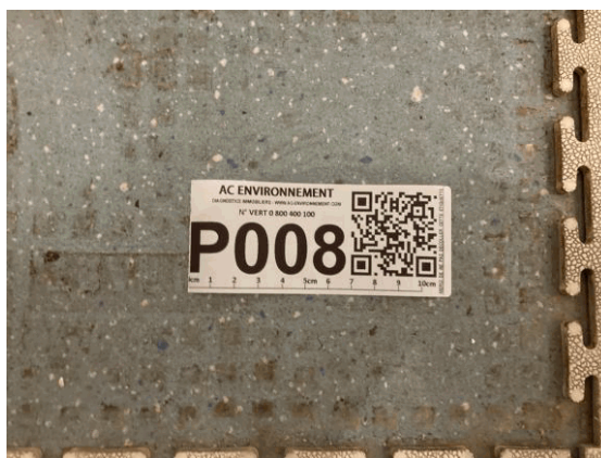
002ER361257 n°8 - 1 (P8) - CAISSE NATIONALE MILITAIRE DU SECURITE SOCIALE - Vol 2 (Cafétéria)