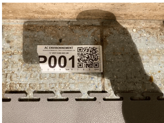
002ER361257 n°1 - 1 (P1) - CAISSE NATIONALE MILITAIRE DU SECURITE SOCIALE - Vol 1 (Sas 1)