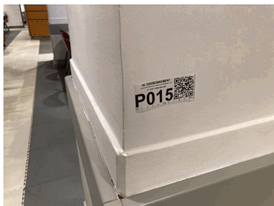
002ER361257 n°15 - 1 (P15) - CAISSE NATIONALE MILITAIRE DU SECURITE SOCIALE - Vol 2 (Cafétéria)