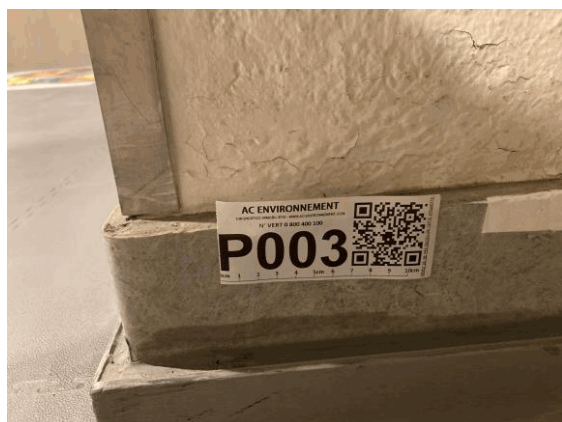
002ER361257 n°3 - 1 (P3) - CAISSE NATIONALE MILITAIRE DU SECURITE SOCIALE - Vol 1 (Sas 1)