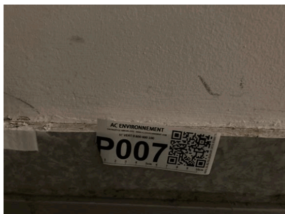
002ER361257 n°7 - 1 (P7) - CAISSE NATIONALE MILITAIRE DU SECURITE SOCIALE - Vol 2 (Cafétéria)