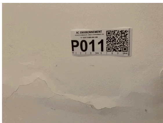
002ER361257 n°11 - 1 (P11) - CAISSE NATIONALE MILITAIRE DU SECURITE SOCIALE - Vol 2 (Cafétéria)