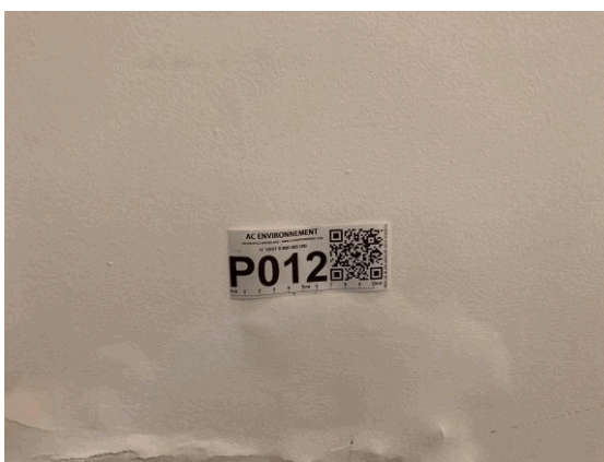
002ER361257 n°12 - 1 (P12) - CAISSE NATIONALE MILITAIRE DU SECURITE SOCIALE - Vol 2 (Cafétéria)