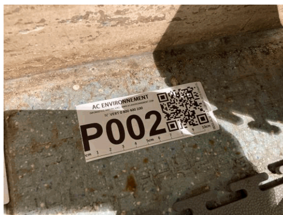
002ER361257 n°2 - 1 (P2) - CAISSE NATIONALE MILITAIRE DU SECURITE SOCIALE - Vol 1 (Sas 1)