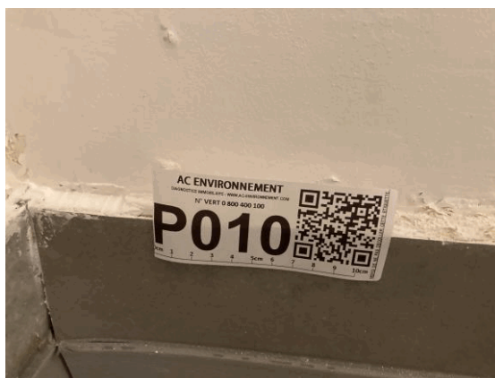
002ER361257 n°10 - 1 (P10) - CAISSE NATIONALE MILITAIRE DU SECURITE SOCIALE - Vol 2 (Cafétéria)