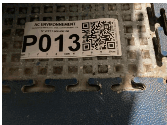
002ER361257 n°13 - 1 (P13) - CAISSE NATIONALE MILITAIRE DU SECURITE SOCIALE - Vol 3 (Sas 2)