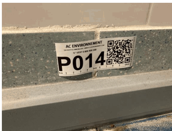
002ER361257 n°14 - 1 (P14) - CAISSE NATIONALE MILITAIRE DU SECURITE SOCIALE - Vol 3 (Sas 2)