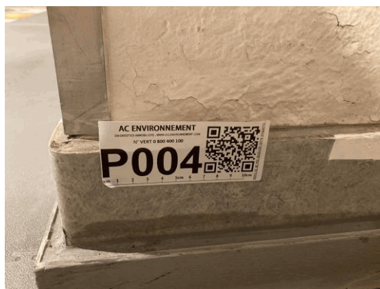
002ER361257 n°4 - 1 (P4) - CAISSE NATIONALE MILITAIRE DU SECURITE SOCIALE - Vol 1 (Sas 1)