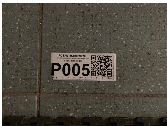
002ER361257 n°5 - 1 (P5) - CAISSE NATIONALE MILITAIRE DU SECURITE SOCIALE - Vol 2 (Cafétéria)